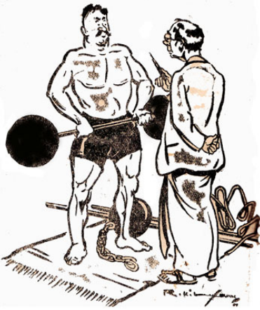
ಸ್ವಾಮಿ, ಇಷ್ಟೆಲ್ಲ ಮಾಡ್ತೀರಲ್ಲ, ಈ ಪೆನ್ನೆನ್ನ ಸ್ವಲ್ಪ ಬಿಚ್ಚಿಕೊಡಿ ನೋಡೋಣ