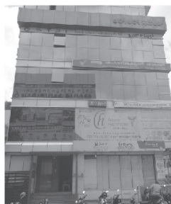
First Franchise Bannerghatta