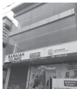
First Branch Yelahanka New Town

24/7 Emergency Healthcare Attached to Memorial Hospital Spacious in Patient Facility