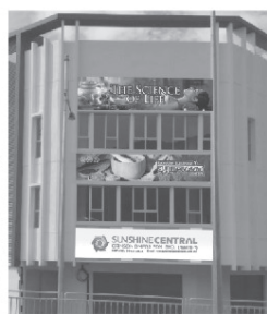
First Joint Venture Penang, Malaysia