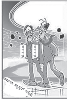
ಒಬ್ಬನ ಹರವಾಗಿಲ್ಲ ವಿದಿ ನಾಡೇ ಸ್ವಾರ್ಥ್ ನ ಲೋಕಸಭೆಯಲ್ಲಿ ಅಗ