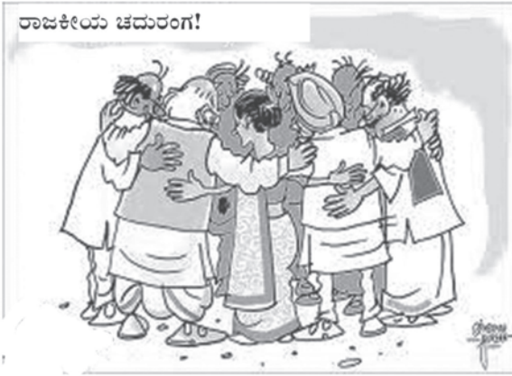
ಅಫೀಸ್ ಅಫ್ ಪಾರ್ಟಿಟ್ ಮುಖವಾಗಿ ಲೋಕಸಭೆಯಲ್ಲಿ ಜಯ